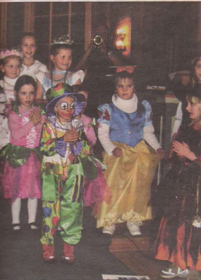
g farge på jazzgudstenesta i Hordabø kyrkje søndag.