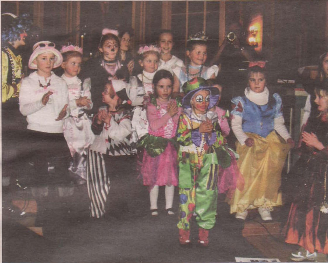
FARGERIKE: Hordabø barnekantori sette verkeleg farge på jazzgudstenesta i Hordabø kyrkje søndag.